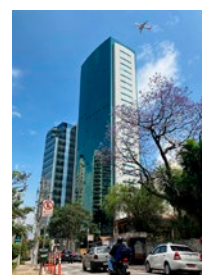
③ K-I CHEMICAL DO BRASIL LTDA.