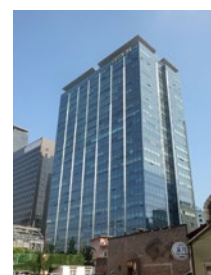
⑩ KUMIKA KOREA CO., LTD.