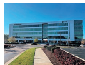
① K-I CHEMICAL U.S.A. INC.