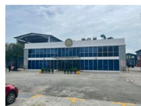
⑥ Asiatic Agricultural Industries Pte. Ltd.